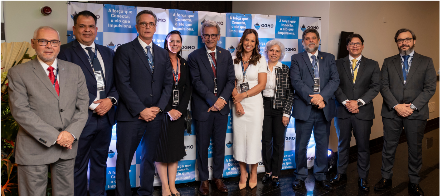
IMAGEM MARCELO ANDRADE

Uma visão abrangente sobre o OGMO/Paranaguá