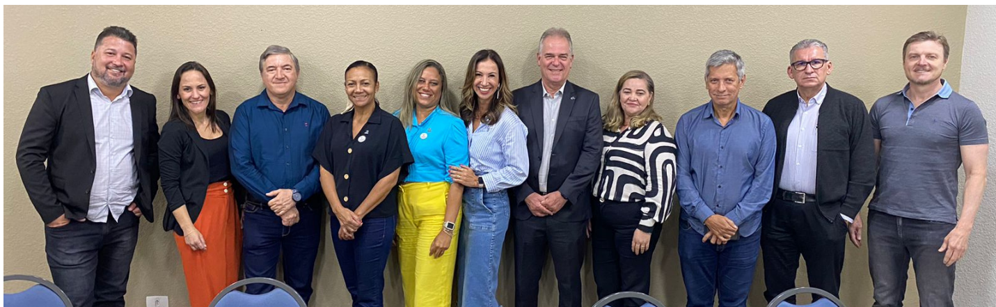
IMAGEM OGMO PARANAGUÁ

Na quarta-feira (24/01), o OGMO/Paranaguá recepcionou em Curitiba (PR), a primeira reunião do Comitê Técnico de OGMO's da FENOP do calendário 2024.