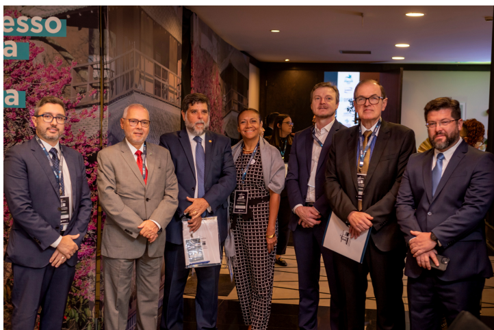
IMAGEM MARCELO ANDRADE