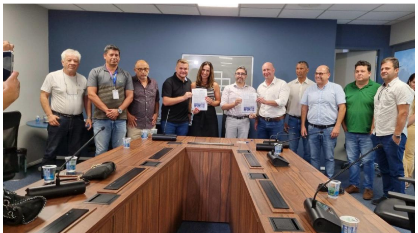
IMAGEM PORTOS DO PARANÁ